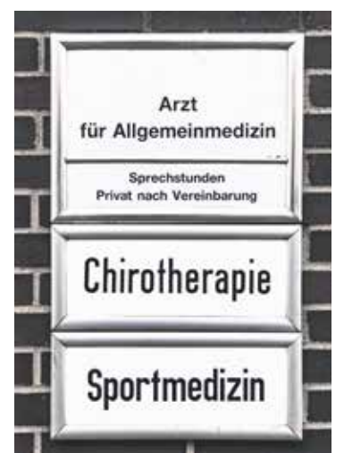
Erst in die hausärztliche Praxis, dann zu Spezialist*innen? Das sieht das Hausarztmodell vor.

Hinzu kommt, dass nicht jede Praxis dieses Modell anbietet, womöglich ist also ein Wechsel der hausärztlichen Versorgung nötig. Wer Interesse am Hausarztmodell hat, bekommt bei der Krankenkasse mehr Informationen zu teilnehmenden Praxen. str/dpa