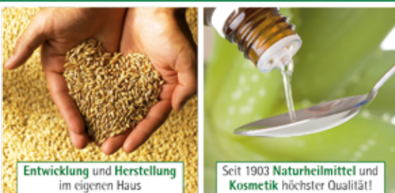
Entwicklung und Herstellung im eigenen Haus