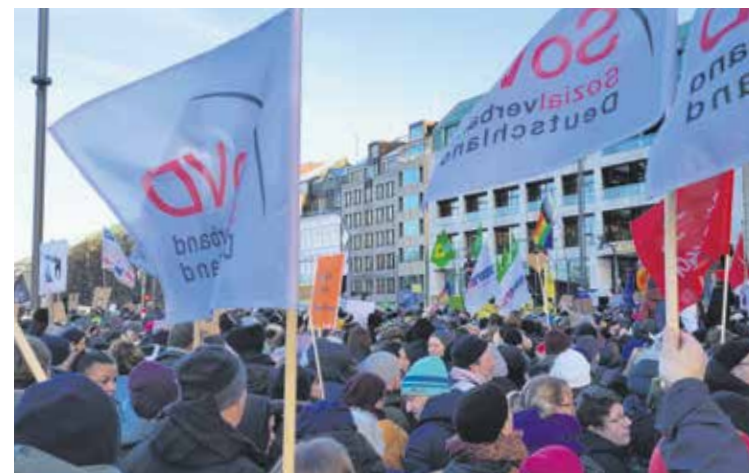
Am 28. Januar fand die zweite Großdemo in Hamburg mit geschätzten 180.000 Menschen statt.