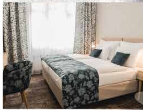
Zimmerbeispiel, 4+ ASTORIA Hotel & Medical Spa