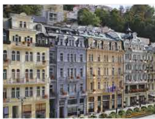
Außenansicht, 4+ ASTORIA Hotel & Medical Spa

Freizeit/Kur/Unterhaltung: Im neuen Wellnesszentrum des Hotels stehen Ihnen ein Schwimmbad (8 x 4 m, ca. 31°C) mit Gegenstromanlage und Massagedüsen, verschiedenen Saunen und Erlebnisduschen zur Verfügung. Hier erhalten Sie zudem die wohltuenden Anwendungen, für die das Hotel das natürliche Mineralwasser der Karlsbader Sprudelquelle nutzt.