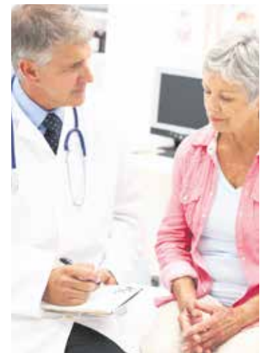
Auch Rentner*innen müssen ab diesem Monat mehr Geld für die Krankenversicherung zahlen.

So wie beim regulären Krankenkassenbeitrag übernimmt die Rentenversicherung auch beim Zusatzbeitrag die Hälfte der Kosten – analog zum Arbeitgeber für berufstätige Versicherte. Hat eine Krankenkasse ihren Zusatzbeitrag also beispielsweise um 0,8 Prozent erhöht, erhalten Rentner*innen 0,4 Prozent weniger Rente. Diese leitet die Rentenversicherung direkt an die jeweilige Krankenkasse weiter. Bei einer Rente von 1.000 Euro führt das in diesem Beispiel zu einer um 4 Euro niedrigeren Auszahlung. str