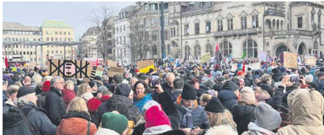
Am 21. Januar versammelten sich rund 50.000 Menschen auf dem Bremer Marktplatz, darunter auch zahlreiche Mitglieder aus dem SoVD-Landesverband Bremen.